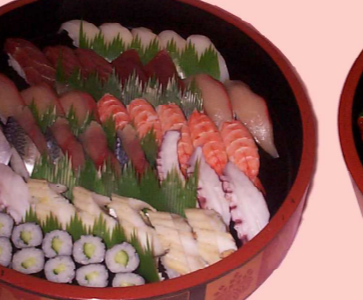
上にぎり 5人前 9900