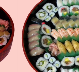
盛り合せ 5~6人前 5600