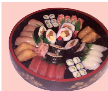
盛り合せ 3~4人前 3300