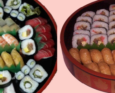
助六 5~6人前 3000