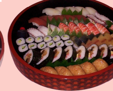
盛り合せ 5人前 4350