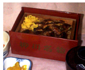
らなぎセイロ蒸し 2000